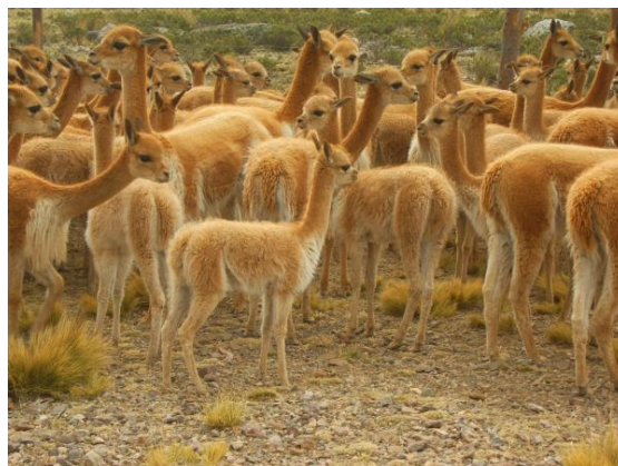
Page 3 de 8 - Copyright Europe Active - 22 Septembre 2021