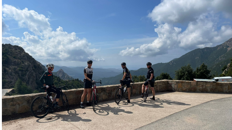
Jour 3 - Saint Florent - Calvi