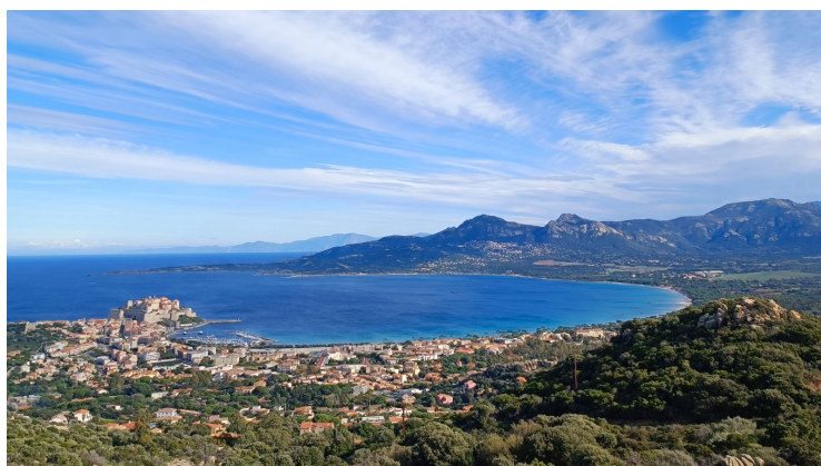
Jour 4 - Calvi - Porto