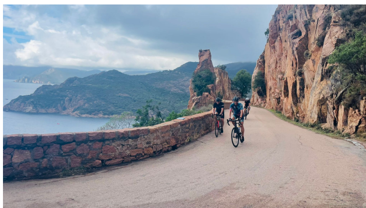
Jour 5 - Porto - Corte