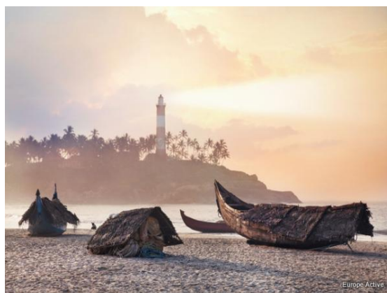
Page 5 de 9 - Copyright Europe Active - 4 Avril 2025