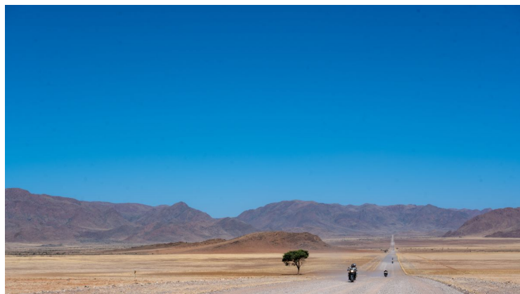
Page 4 de 10 - Copyright Europe Active - 23 Novembre 2024

L'itinéraire peut être raccourci à 100 km de gravier et 243 km de route goudronnée pour un total de 343 km.